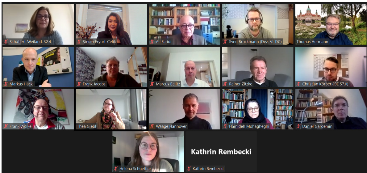
Fotoausschnitt aus der digitalen KPR Sitzung vom 14. Dezember 2021

Der KPR hat die Maßnahmen zur Erreichung seiner Ziele umgesetzt und im Rahmen von digitalen Sitzungen wurde die kommunale Prävention in Hannover weiter gemeinsam vorangetrieben.