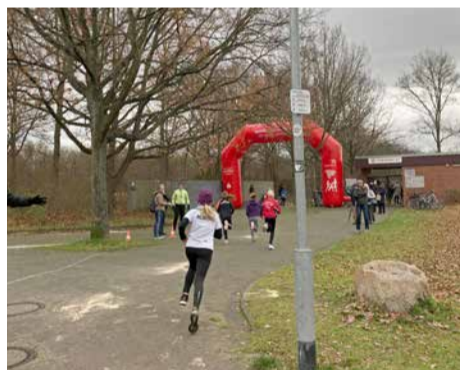
Alle drei Laufstrecken starten am Mühlenberger SV.

Kleine weiße Metallschilder weisen den Weg. Sie sind an Straßenlaternen oder Straßenschildern montiert. Auch schon gelaufene Kilometer ab dem Startpunkt am Mühlenberger Sportverein sind angegeben. Die ausgewiesenen Strecken