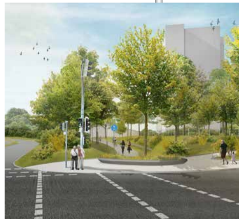
Perspektiven Spielplatz und Wegekreuzung: Büro Christine Früh