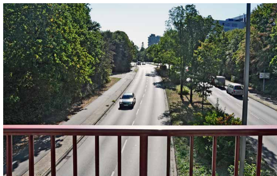
Nebenwege und breite 4-spurige Fahrbahn der Bornumer Straße.

Der Bau beginnt voraussichtlich im Herbst 2020. Dieses Projekt ist in verschiedenen, zeitlich versetzten Bauabschnitten geplant. Die Wegestrukturen vom Canarisweg in Richtung Grünfläche und Spielplatz werden besser ausgebaut und an die neue Gestaltung angepasst. Die Wege von den Häusern im Canarisweg zur Bornumer Straße werden breiter, offener und barrierefrei ausgebaut. Dabei soll die bestehende Radwegeverbindung erhalten und verbessert werden. Der Radweg wird teilweise verlegt, so dass er nicht mehr durch den Spielplatz führt. Geplanter Baubeginn ist im Herbst 2020. Es wird mit etwa einem Jahr für die Bauarbeiten gerechnet, so dass die Wegeverbindung Ende 2021 fertig sein soll.