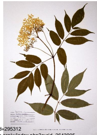
Bild oben: CC BY-SA 3.0, https://commons.wikimedia.org/w/index.php?curid=295312

Bild Mitte rechts: Willow - Own work, CC BY 2.5, https://commons.wikimedia.org/w/index.php?curid=2643905