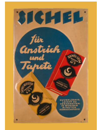
Blechschild VM 048148