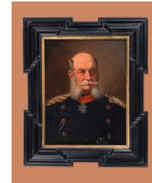
Kaiser Wilhelm I. VM 035075