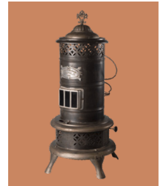
Petroleumofen VM 027201