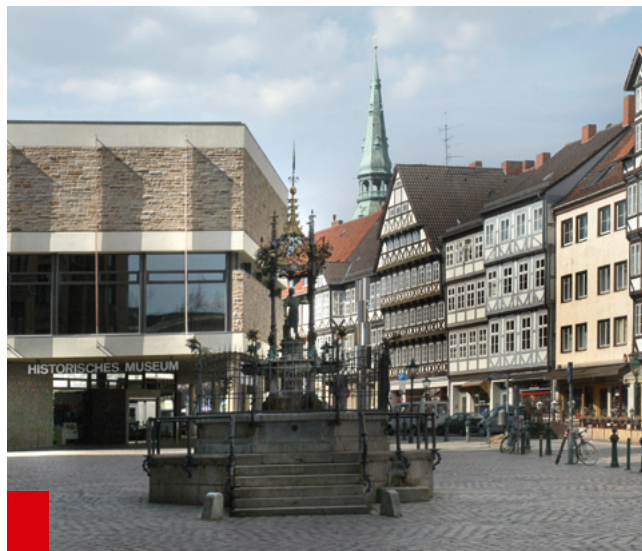
Oskar-Winter-Brunnen vor dem Historischen Museum Hannover

Viel Freude beim Stöbern in Hannovers Geschichte und herzlichen Dank für Ihr Engagement und Ihre Verbundenheit mit unserem Historischen Museum.