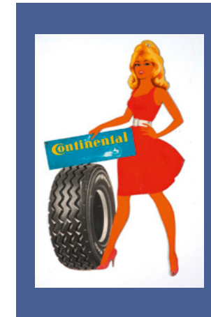
Blechschild VM 042691