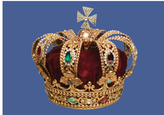
Nachbildung der hannoverschen Königskrone von 1837, schmückte den Sarg von König Georg V., gestorben 1878 – VM 021089

Sie erhalten zu Ihrer Patenschaft eine persönliche Urkunde. Ihr Name wird außerdem an geeigneter Stelle im Museum genannt werden. Freuen Sie sich auf weitere Vorteile nach der Neueröffnung des Museums. Wir halten Sie auf dem Laufenden.