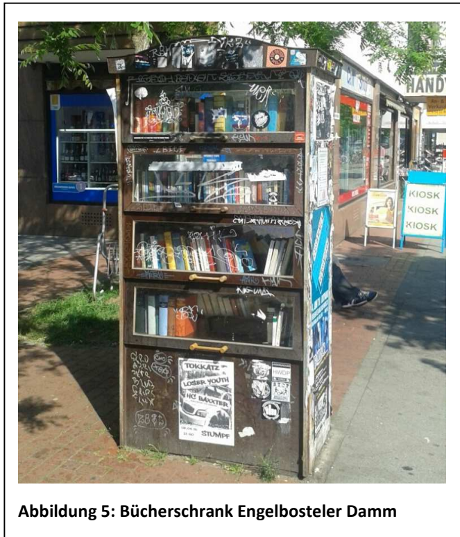
Abbildung 5: Bücherschrank Engelbosteler Damm