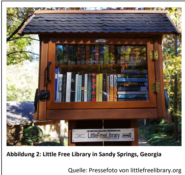
Abbildung 2: Little Free Library in Sandy Springs, Georgia

In den USA und Kanada gehen die Bücherschränke eher auf private Initiativen zurück. Meist stehen sie auf dem Grundstück von Privatpersonen und werden auch durch diese gebaut und gepflegt. Die grundlegende Funktion ist aber gleich. Öffentliche Bücherschränke dienen dem Austausch von Büchern 24 Stunden am Tag und 365 Tage im Jahr, sind öffentlich frei zugänglich (Gollner, Webster & Nathan, 2013, S. 1; Webster, Gollner & Nathan, 2015, S. 3). Als Beitrag zu besserer Nachbarschaft dienen viele der eher kleinen Bücherschränke mit oft nur 40 bis 80 Stellplätzen nicht nur dem Austausch von Büchern, sondern haben auch noch seitlich eine Tafel für Notizen oder ein Schwarzes Brett für Nachrichten (Webster et al., 2015, S. 12). Öffentliche Bücherschränke werden in den USA von einigen Akteuren aber auch als Fanal bürgerlichen Engagements gesehen. Über die „peoples library“ im Zucotti Park in New York sind sie mit der Occupy-Bewegung und dem Widerstand gegen die Finanzmärkte verbunden (Mattern, 2012, S. 3): „Define the community by a culturally meaningful form of sharing“ war hier ein Leitgedanke. Mattern (2012, S. 3) fasst diese Wertung der Bücherschränke wie folgt zusammen: