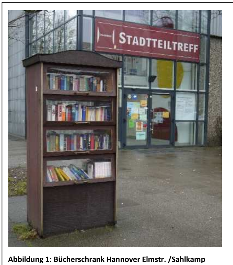
Abbildung 1: Bücherschrank Hannover Elmstr. /Sahlkamp

In Hannover sind die Bücherschränke im Wesentlichen alle gleich, Sie werden von der Stadt finanziert und durch den Werkstatttreff Vahrenheide gebaut. Die Bücherschränke sind mit ca. 300 Stellplätzen für Bücher vergleichsweise groß und werden jeder durch eine Patin oder einen Paten betreut.