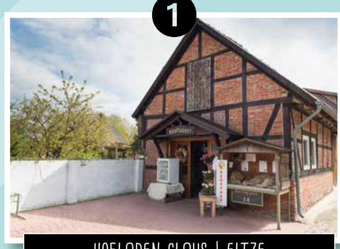
1 HOF-LADEN CLAUS | ELTZE