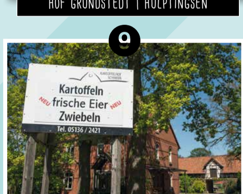
9 KARTOFFELHOF SCHWEER | HÜLPTINGENSEN