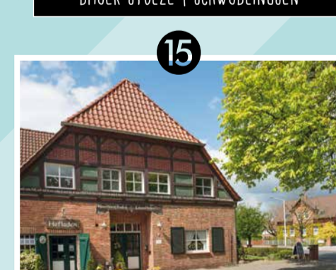
15 JÜRN'S HOF | IMMENSEN