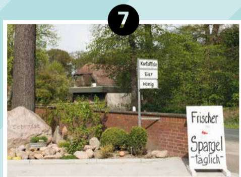
7 HOF SCHRADER | DACHTMISSEN