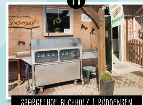
11 SPARGELHOF BUCHHOLZ | RÖDDENSEN