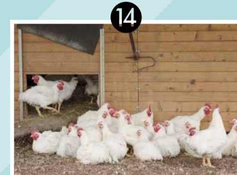
14 BAUER STOLZE | SCHWÜBLINGSEN