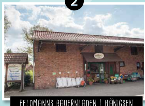
2 FELDMANN'S BAUERNLADEN | HÄNIGSEN