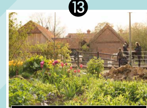
13 KARTOFFELHOF HENNIES | SCHWÜBLINGSEN