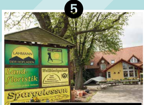
5 ERLEBNISHOF LAHMANN | OTZE