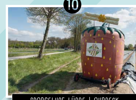
10 SPARGELHOF LÜBBECKE | AHRBECK