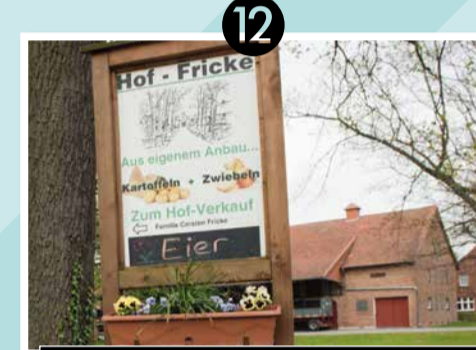
12 HOF FRICKE | SCHWÜBLINGSEN