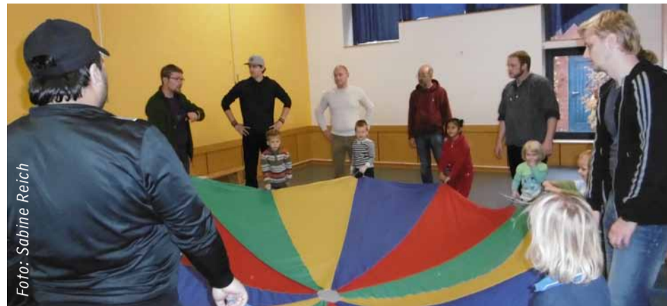
Das macht richtig Wind: Väter und Kinder haben Spaß mit dem Schwungtuch.