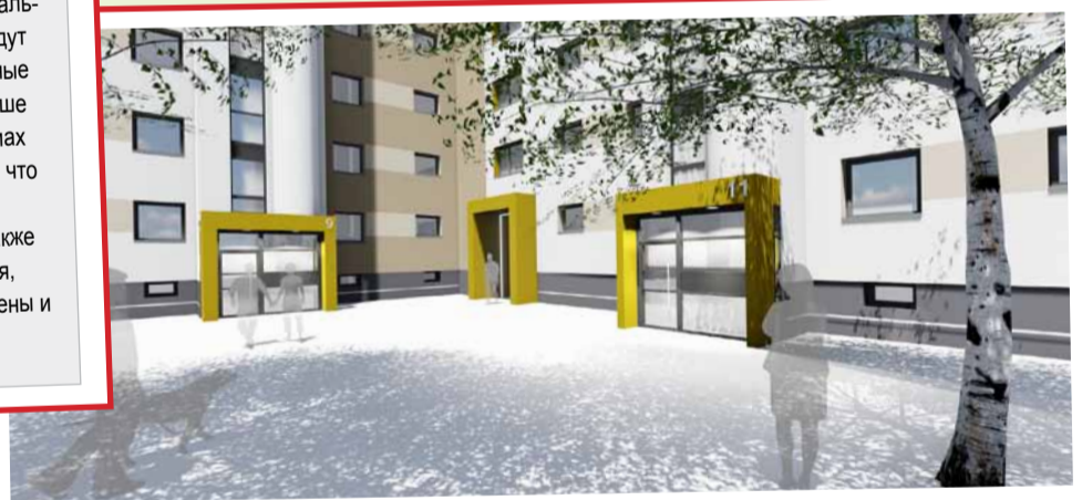
Visualisierungen: argeplan ag

Новый концепт цвета и оформления жилого двора будет служить жильцам и их гостям для лёгкой ориентации и быстрого нахождения адреса. На собрании арендаторов из всех предложенных цветов был выбран тёплый жёлтый тон. В таком жёлтом цвете будут окрашены проходы между домами на Schwarzwalddstraße и парадные входы с внешней стороны. А также номера домов будут сделаны ещё более заметными.