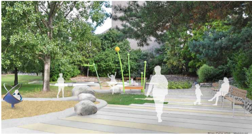
So freundlich soll bald die „Sonnenterrasse“ aussehen. Visualisierung: Büro Grün plan

Für die kommenden Monate sind kleinere Mitmachaktionen im Park geplant, über die Angebote und die dazugehörigen Termine wird rechtzeitig informiert. Und haben Sie vielleicht selbst eine Idee für eine Aktion? Dann sprechen Sie Quartiersmanagerin Anja Gerhardt gerne an. Telefon: (0511) 60 69 88 15, E-Mail: anja.gerhardt@hannover-stadt.de