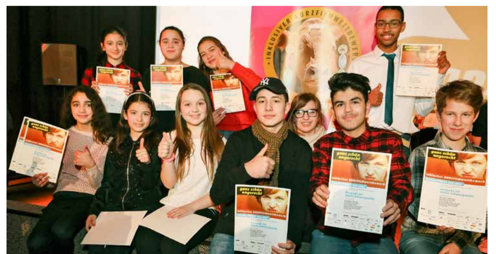
Glückliche Gewinner: die Jugendlichen aus dem Sahlkamp.