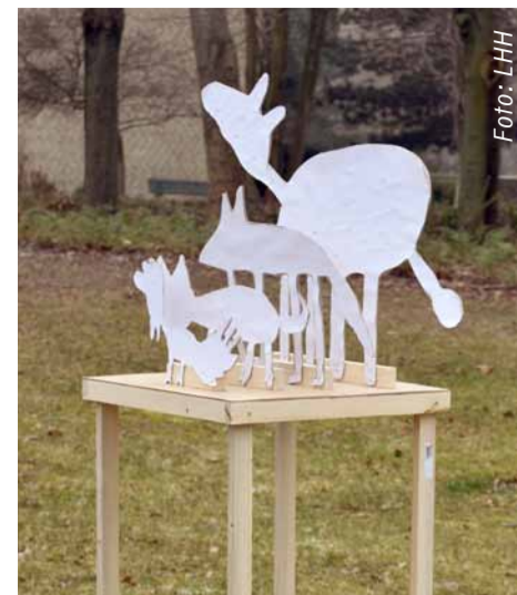
Das Modell der „Bremer Stadtmusikanten“ mit Esel, Fuchs, Katze und Hahn.