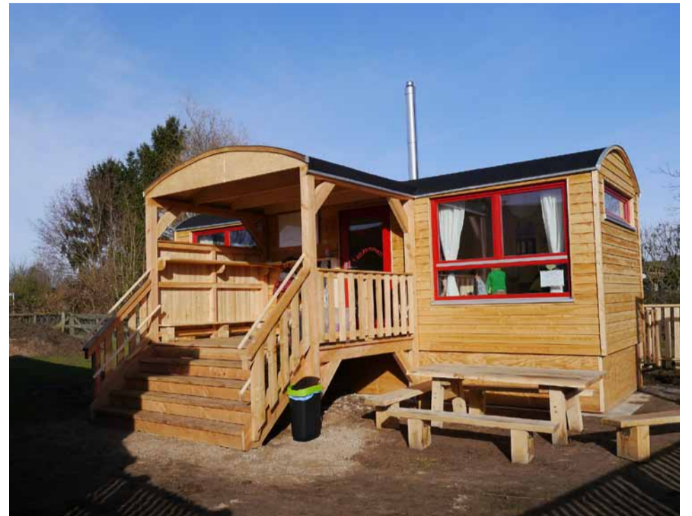
Ein großer Bauwagen dient als behaglicher Rückzugsort für die Kinder.

Nach Herzenslust Toben im Grünen, täglich vis à vis mit Eseln, Schweinen, Hühnern und Co.: Seit Anfang März hat der Stadtteilbauernhof einen eigenen Kindergarten. Und zwar nicht irgendeinen. Passend zum Umfeld hat der Träger des Bauernhofs, der SPATS e.V., einen kleinen Naturkinderladen eröffnet. Zwei Erzieherinnen betreuen von 8 bis 13 Uhr 15 Mädchen und Jungen im Alter von drei bis sechs Jahren.