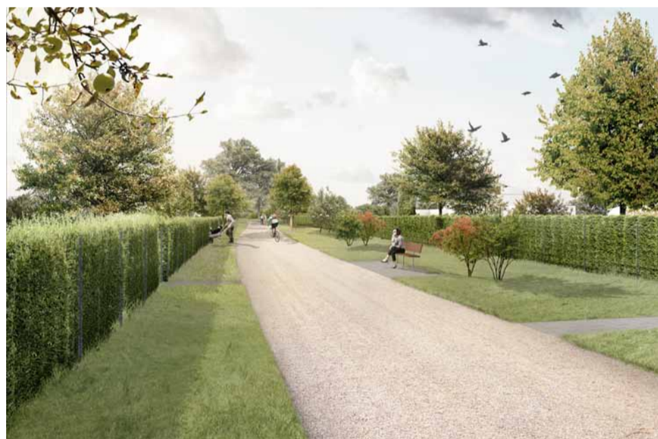
Viel Platz zwischen den Gärten: So soll es nächstes Jahr in der Kolonie Fuchswinkel aussehen.

Auch die Vorbereitungen für die Umgestaltung des Wendehammers im Dornröschenweg laufen weiter. Hier wird in diesem Jahr unter Beteiligung der AnliegerInnen ein Planungsentwurf erarbeitet. ○