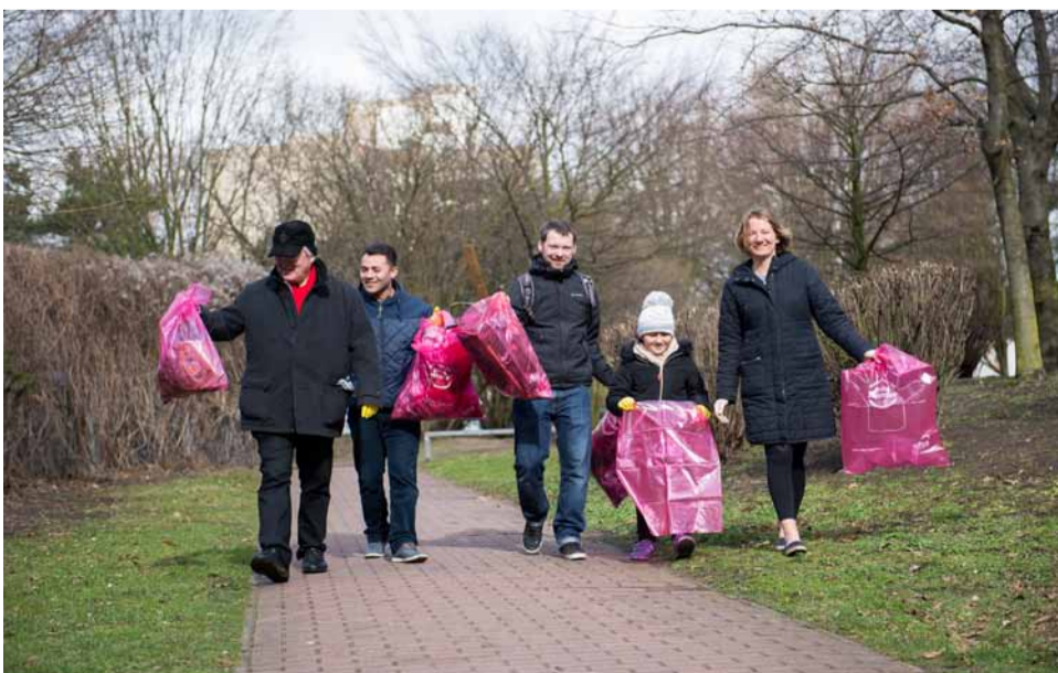
Viele BewohnerInnen aus dem Sahlkamp halfen eifrig mit und sammelten herumliegenden Müll in pinkfarbene Säcke.