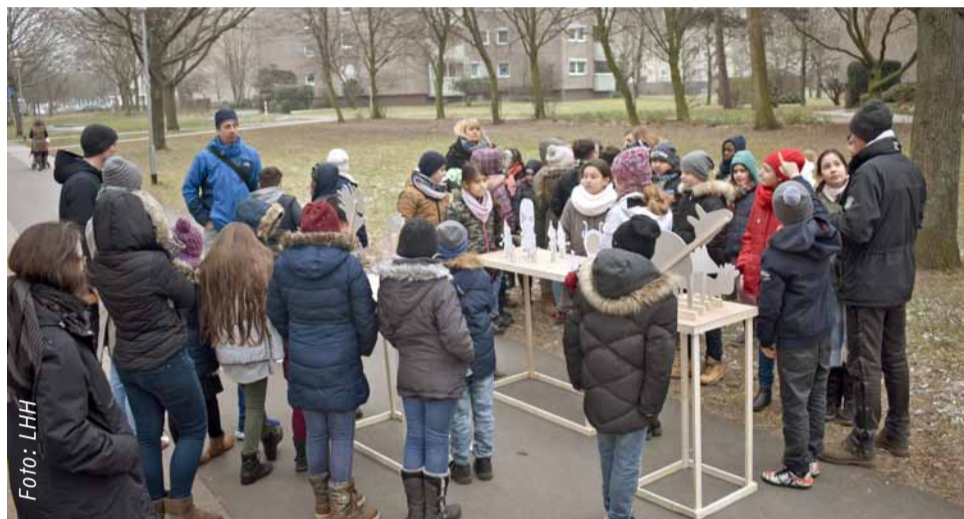
Um die Orte für die Figuren fest zu legen, kamen die Kinder am Märchenweg zusammen.