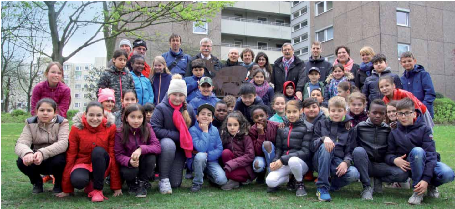
Die jungen KünstlerInnen aus der Grundschule Högewiesen sind sehr zufrieden mit dem Ergebnis ihrer Ideen.