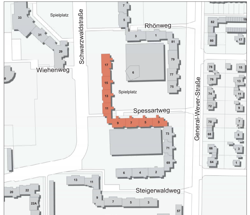
Die markierte Häuserreihe, Spessartweg 3 bis 17, wird als erstes modernisiert. Später sollen weitere Häuser folgen.

Der Beginn der Sanierung wird mit einer großen Auftaktveranstaltung mit anschließendem Hoffest am Montag, 15. Mai, im Innenhof des Spessartwegs 3-17 gefeiert. Die offizielle Auftaktveranstaltung beginnt um 16 Uhr. Um 17.30 Uhr schließt sich dann ein BewohnerInnenfest an. ○