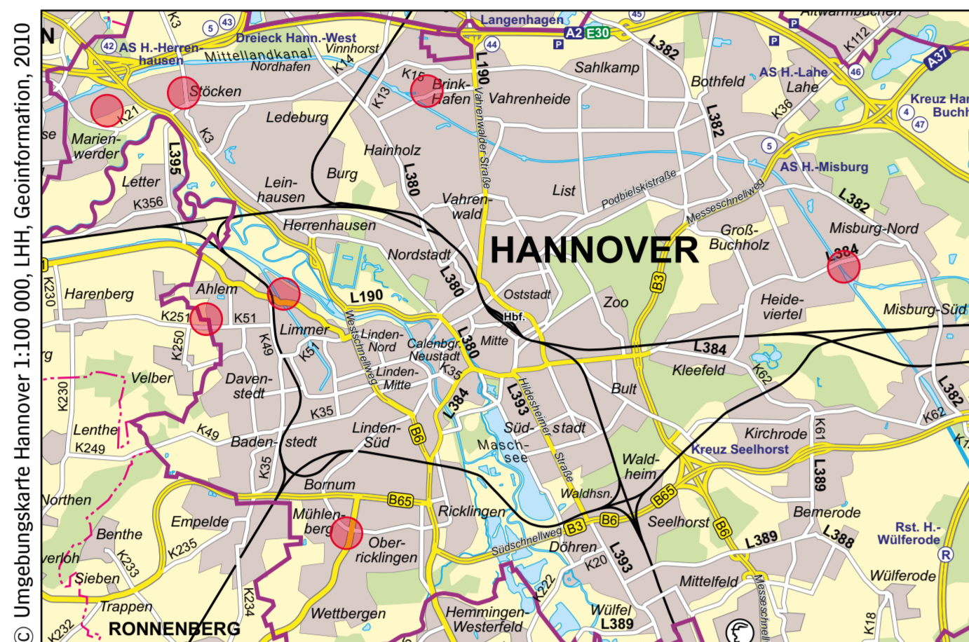
KZ-Standorte 1943 – 1945

Die Konzentrationslager (KZ) im Raum Hannover waren Außenlager des KZ Neuengamme bei Hamburg. Mit Ausnahme vom KZ Ahlem wurden die hannoverschen Außenlager in der Nähe von großen Industriebetrieben eingerichtet. Das Rüstungsministerium und die Industrie forderten ab 1942 verstärkt den Einsatz von KZ-Häftlingen als Arbeitskräfte. Als erstes Außenlager in Hannover war im Juli 1943 das KZ bei der Akkumulatorenfabrik in Stöcken entstanden. Das zweite KZ befand sich seit Juni 1944 bei der Erdölraffinerie Deurag-Nerag in Misburg. In Limmer wurde ein Frauen-KZ bei den Continental Gummi-Werken eingerichtet, wo u.a. Gasmasken hergestellt wurden. Ein Frauen-KZ entstand im November 1944 bei den Brinker Eisenwerken (Munitionsherstellung und Flugzeugreparatur) in Langenhagen. Ein fünftes Außenlager wurde bei der Conti-Reifenproduktion in Stöcken, Stelinger Straße, im September 1944 eingerichtet. Als sechstes Lager entstand das in Ahlem und als siebentes das Lager Mühlenberg bei der Hanomag, wo Fliegerabwehrgeschütze hergestellt wurden.