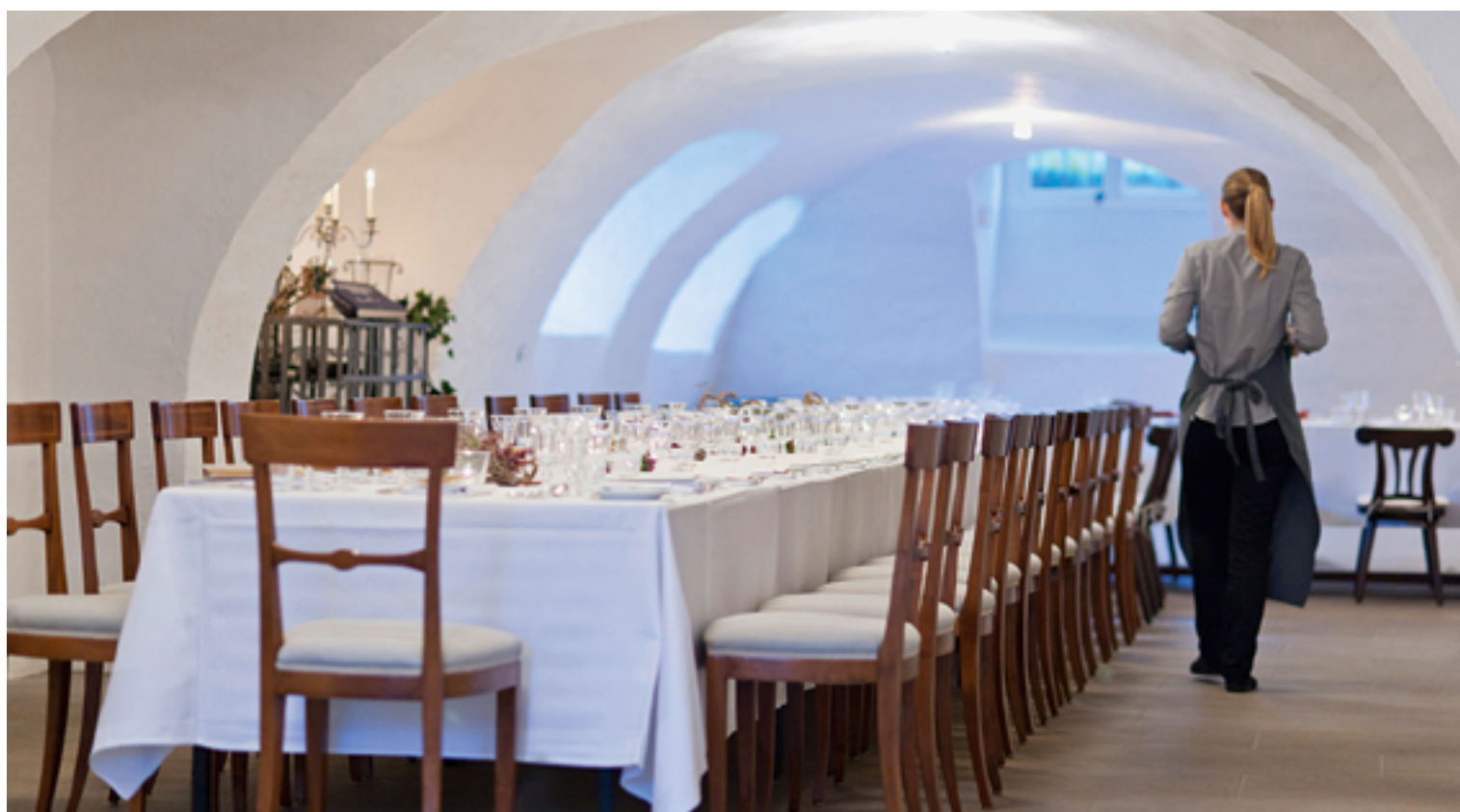
Gewölbekeller Vaulted cellar