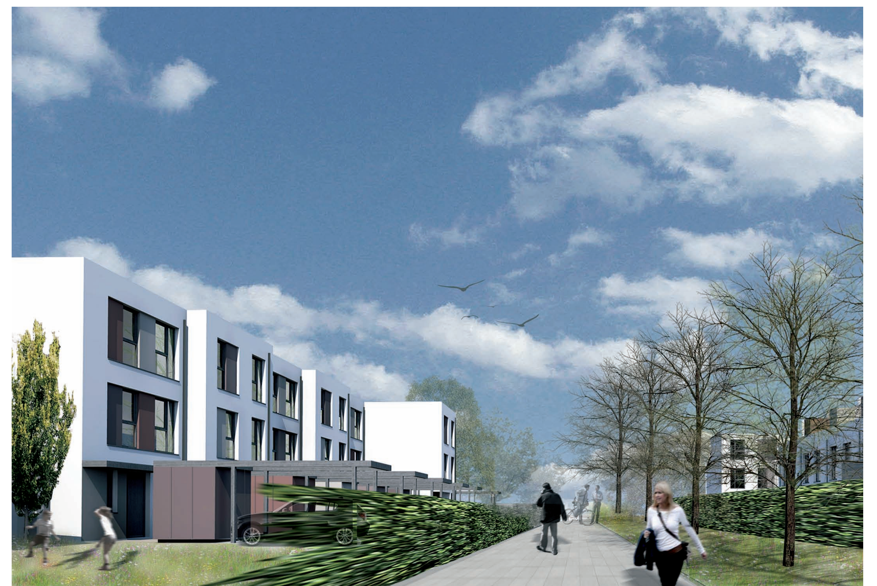
Grünverbindung durch den Auengarten