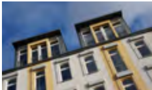
Wohnhaus Schneiderberg 17