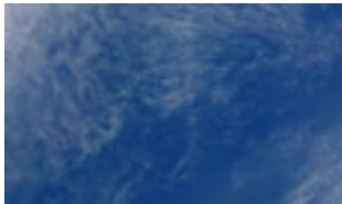
Hören Sie mal ...