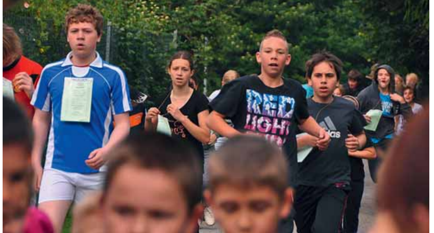
Sie geben alles beim Spendenlauf: SchülerInnen der IGS Vahrenheide-Sahlkamp und der Grundschule Tegelweg.

Ein feierlicher Erntedankgottesdienst der Epiphantias-Kirchengemeinde wird am Sonntag, 30. September , auf dem Stadtteilbauernhof stattfinden.