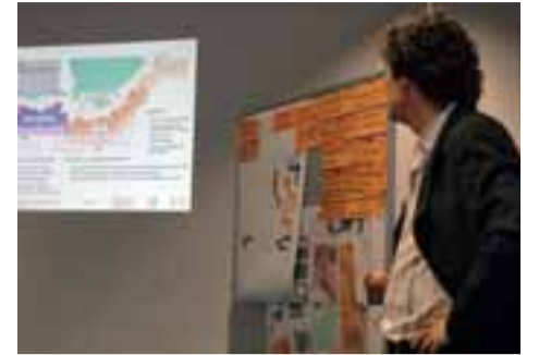
Eine Präsentation bildet die Grundlage für den Austausch.

Ein erstes internes Arbeitstreffen zu diesem Thema fand bereits im Februar statt und diente dem Austausch zwischen den verantwortlichen AkteurInnen der zukünftigen Sanierung, den MitarbeiterInnen der Prelios GmbH und der Stadtverwaltung. Auch in der öffentlichen Sitzung der Sanierungskommission am 12. März wurden die Zwischenergebnisse des Gutachtens der Politik und interessierten EinwohnerInnen vor- und zur Diskussion gestellt.