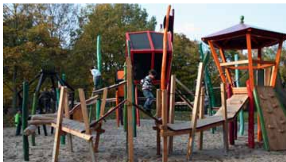
Die phantasievolle „Geisterbahn“ kommt bei den Kindern besonders gut an.