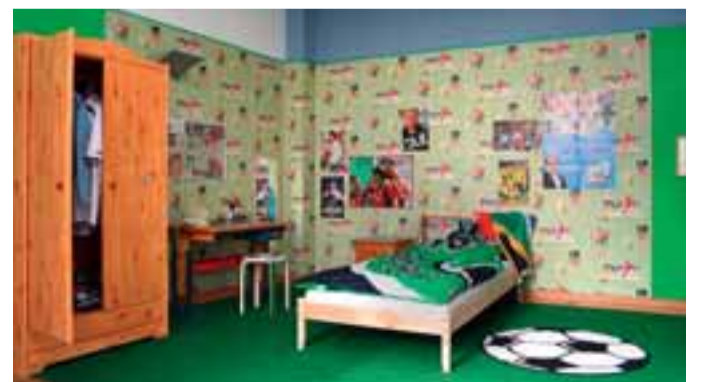
Das Hannover-96-Fanzimmer ist ein Teil der Ausstellung.

Die Ausstellung richtete sich in erster Linie an Schulklassen und Hortgruppen, aber auch an Sportvereine und interessierte Eltern mit Kindern. Die Ausstellung ist dienstags und donnerstags