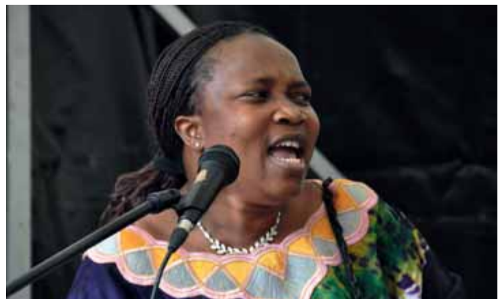
Viele kulturelle Beiträge machen den Internationalen Tag zu einem Erlebnis.

Viele Kulturen sind auf dem Fest bereits mit einem Beitrag oder einem Stand vertreten. Wer noch mitmachen möchte, wird gebeten, sich bis zum 4. Juni unter der Telefonnummer (0511) 16 84 80 51 anzumelden. ○