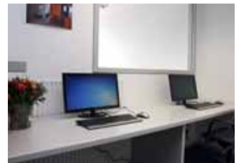
Viel Glas und kräftige Farben prägen die hellen Räume des Ladens an der Schwarzwaldstraße 33 b.

Europäischen Sozialfonds der Europäischen Union, des Bundesministeriums für Verkehr, Bau und Stadtentwicklung, der Landeshauptstadt Hannover (LHH) und des Wohnungsbauunternehmens Prelios finanziert. ○