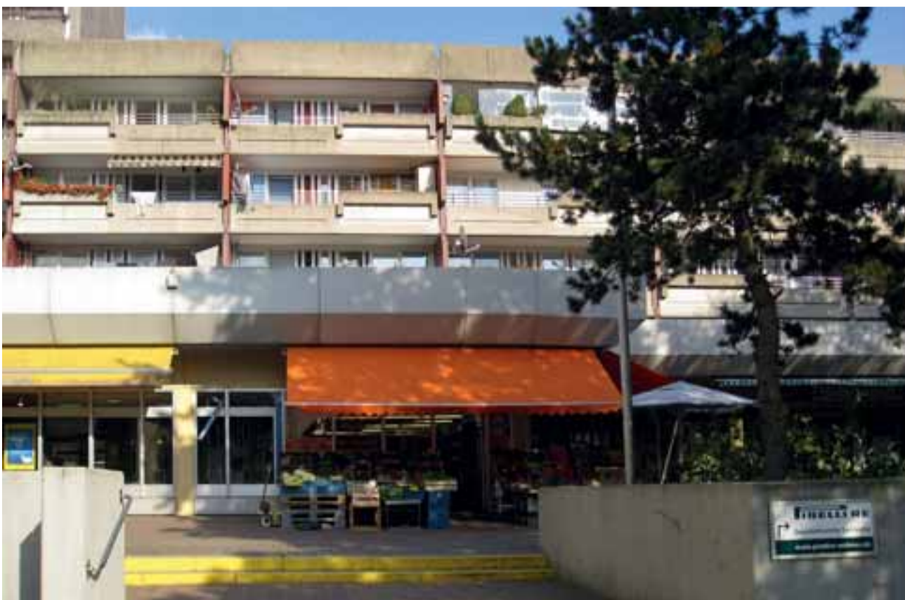
Auch die Zugänglichkeit der Ladenzeile Högewiesen wird untersucht.

Elmstraße und die Wohnhöfe am Rhönweg, Spessartweg und Steigerwaldweg. Es bestätigte sich, dass das Image des Stadtteils Sahlkamp stark am Zustand und der Funktion des Hochhauses an