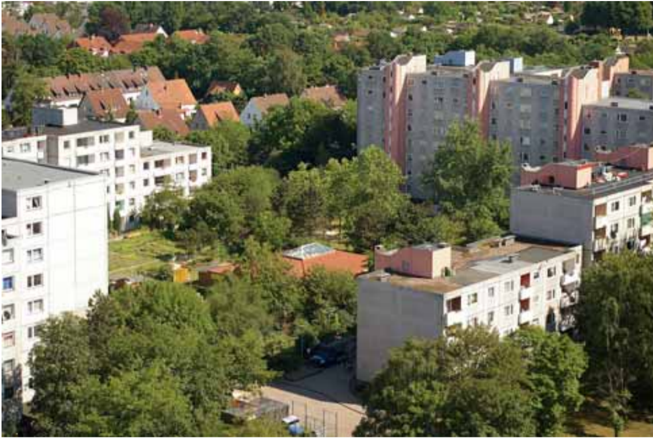
Das viele Grün spielt eine wichtige Rolle bei den Planungen.