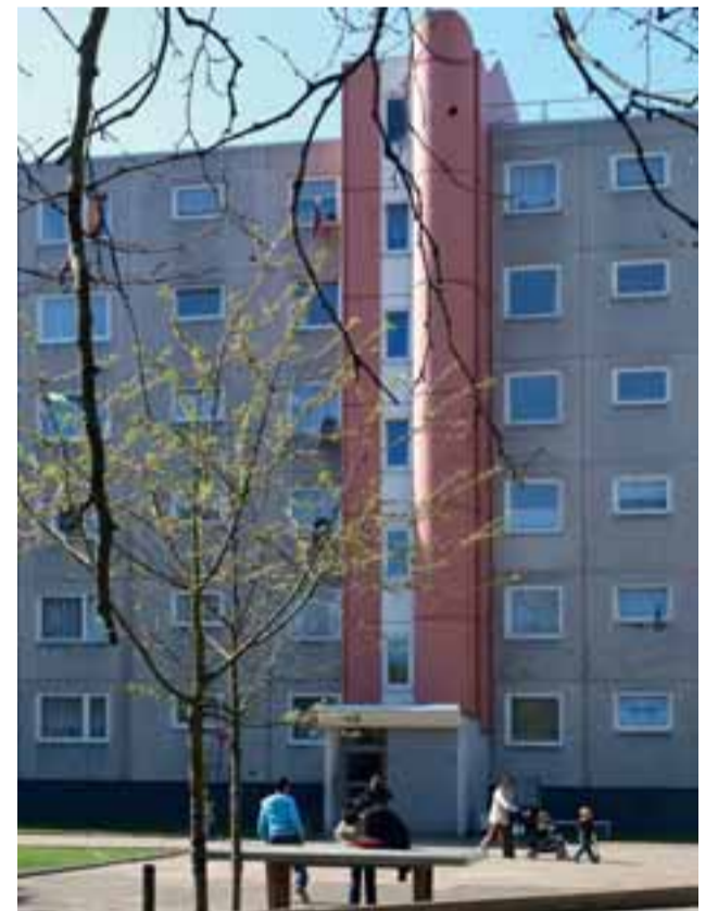
Die in die Jahre gekommenen Fassaden und Hauseingänge prägen die Wohnhöfe.