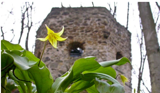
Hundszahn am „Hexenturm“