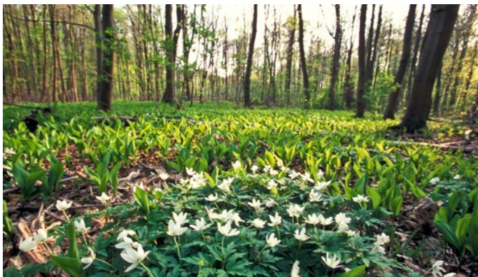
Frühling in der Eilenriede