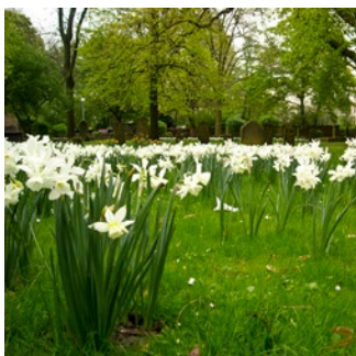
Engelstränen-Narzissen auf den historischen Friedhöfen