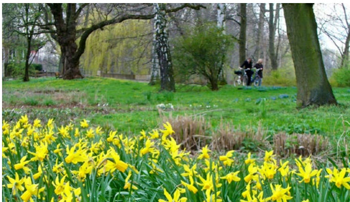
Alpenveilchen-Narzissen an der Maschseequelle