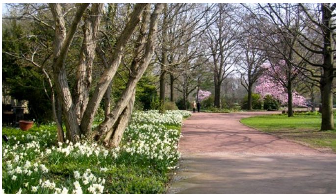
Narzissen „Ice Follies“ am Haupteingang