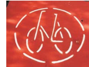
Fahrradsymbole kennzeichnen die Fahrbahn

Wir wünschen allen Verkehrsteilnehmern eine gute und sichere Fahrt!