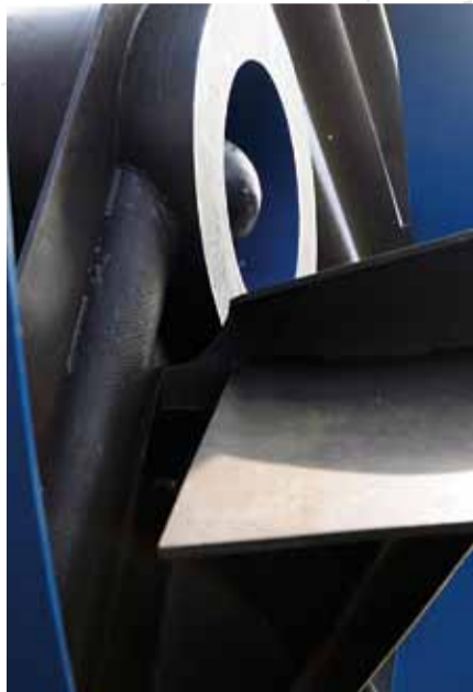
Bernhard Heiliger »Deus ex machina«, Eisen teilweise farbig gefasst, 1985 aufgestellt.