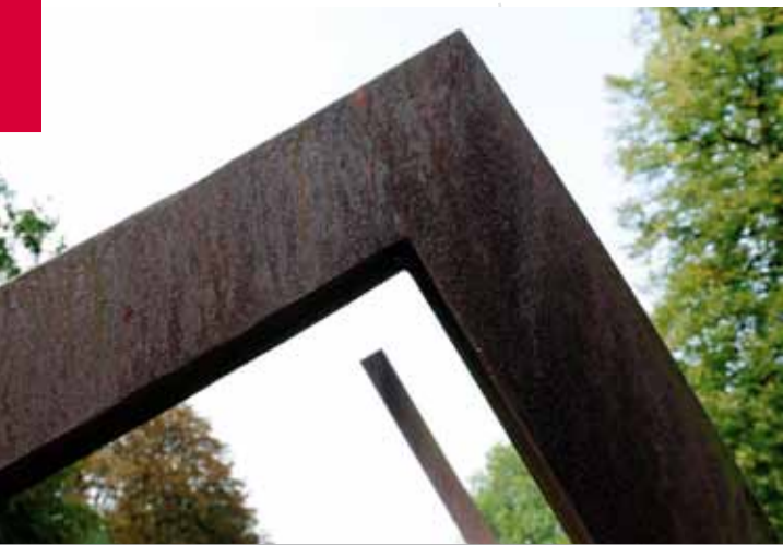
Alf Lechner »Kreisteilung – Quadratanordnung – Kugel«, Cortenstahl, 1987 aufgestellt.

1 Die geometrischen (De)Konstruktionen der Arbeit von Alf Lechner (* 1925 in München) erschließen sich der Betrachtung vor allem beim Umschreiten: Die sich so ergebenden Perspektivwechsel lassen aus einzelnen Elementen dynamisch immer neue Formen entstehen. Die Plastik kam als Exponat der Ausstellung »Stahl 1« der Galerie kö 24 nach Hannover. Sie bietet an ihrem Aufstellungsort einen sinnlich erfahrbaren Übergang zwischen der Ruhe des Parks und der Belebtheit des Verkehrsknotenpunktes und betont auf diese Weise einen Wechsel im Stadtgefüge und zugleich den Beginn der »Skulpturenmeile«.