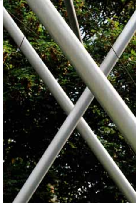
Kenneth Snelson »Avenue K«, Aluminium und Stahlseile, 1970 erstmals aufgestellt, zuletzt 1997 neu platziert.

» Standort: Leibnizufer (Höhe Friederikenplatz)