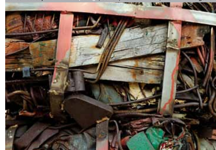
János Nádasdy »Leineentrümpelung«, Schrott, Müll und Metall, 1981–1991 aufgestellt.

12 Die für den Künstler in ihrer Machart charakteristische Plastik von Kenneth Snelson (* 1927 in Pendleton, USA) wurde im Rahmen des »Straßenkunstprogramms« in Hannover installiert, zunächst auf einer Rasenfläche am Leineschloss. Snelson beschäftigt sich mit dem Wirken physikalischer Kräfte als grundsätzlichem Prinzip und deren Darstellbarkeit im Raum. Dabei stehen Wiederholungen und Verschiebungen im Vordergrund. »Avenue K« suggeriert Raum und Richtung – am aktuellen Standort verbindet sie die »Skulpturenmeile« am Leibnizufer mit dem stark befahrenen Friederikenplatz und anderen zentralen Stadtachsen.