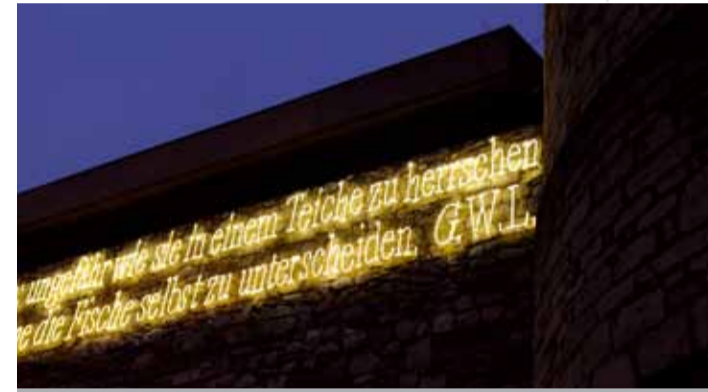
Joseph Kosuth »o. T.«, Leuchtstoffröhren, 2000 angebracht.

10 Der international bedeutende Konzeptkünstler Joseph Kosuth (* 1945 in Toledo, USA) wählte für seine Lichtinstallation ein Zitat des hannoverschen Gelehrten Gottfried Wilhelm Leibniz (1646–1716), welches einen zentralen Gedanken aus dessen metaphysischen Theorien andeutet. Der nachts leuchtende Schriftzug befindet sich an der Rückwand des Historischen Museums, einem Teil des Zeughauses aus dem 17. Jahrhundert. Er wirkt jedoch bis zum Leibnizufer, von wo sich die im Zitat thematisierte Entfernungswahrnehmung auf das Objekt selbst übertragen lässt. Die Arbeit ist ein Geschenk der Niedersächsischen Sparkassenstiftung. Sie korrespondiert mit einer weiteren Leuchtschrift des Künstlers im Hof des VGH-Gebäudes am Schiffgraben.