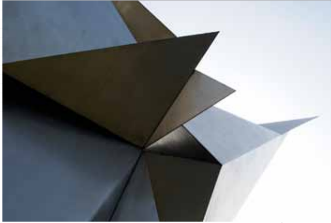
Erich Hauser »Stahl 17/87«, Edelstahl, 1987 aufgestellt.

6 Die Plastik von Bernhard Heiliger (* 1915 in Stettin – † 1995) integriert abstrahierte Versatzstücke technischer Symbolik. Die vielschichtigen formalen Bezüge entfalten ihre Wirkung vor allem bei einer Betrachtung aus unterschiedlichen Perspektiven. Zusammen mit Hans Uhlmann und Karl Hartung, deren Arbeiten ebenfalls im Stadtraum Hannovers vertreten sind, gehört Heiliger zu den bedeutenden Bildhauern der deutschen Nachkriegszeit. »Deus ex machina« war die erste im Rahmen der »Skulpturenmeile« konzeptionell platzierte Plastik.