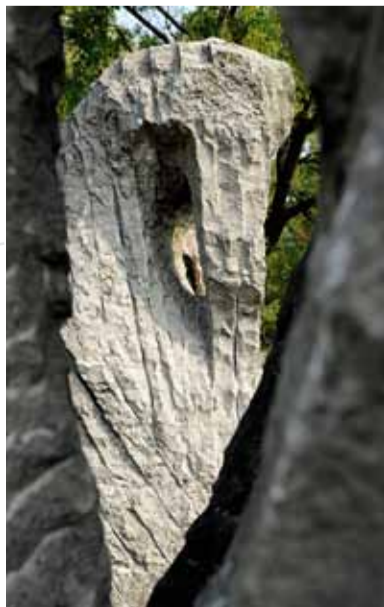
Eugène Dodeigne »Etude I-V«, Granit, 1982 erstmals aufgestellt, 1985 neu platziert.

» Standort: Königsworther Platz (Mittelinsel)