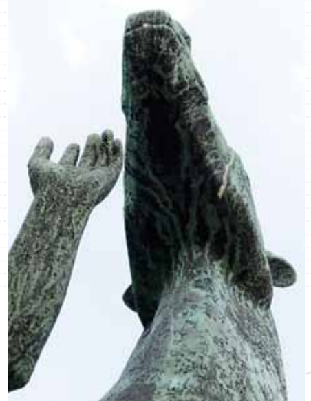
Hermann Scheuernstuhl »Mann mit Pferd«, Bronze, 1957 aufgestellt.

» Standort: Am Hohen Ufer (Höhe Roßmühle)