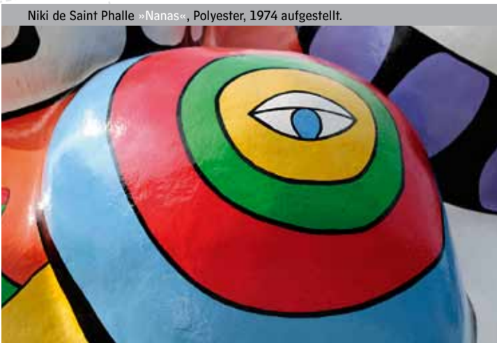
Niki de Saint Phalle »Nanas«, Polyester, 1974 aufgestellt.

» Standort: Leibnizufer (Nähe Marstallbrücke)